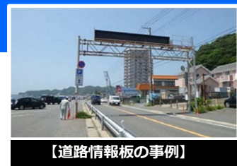
【道路情報板の事例】

報道、関係機関のホームページ、道路情報板、自治体の防災無線等を通じてお知らせします。