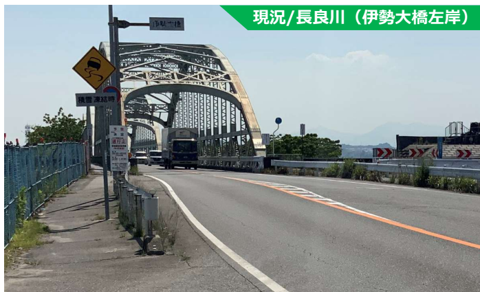
現況/長良川（伊勢大橋左岸）