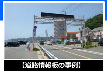
【道路情報板の事例】

報道、関係機関のホームページ、道路情報板、自治体の防災無線等を通じてお知らせします。