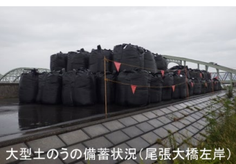
大型土のうの備蓄状況(尾張大橋左岸)