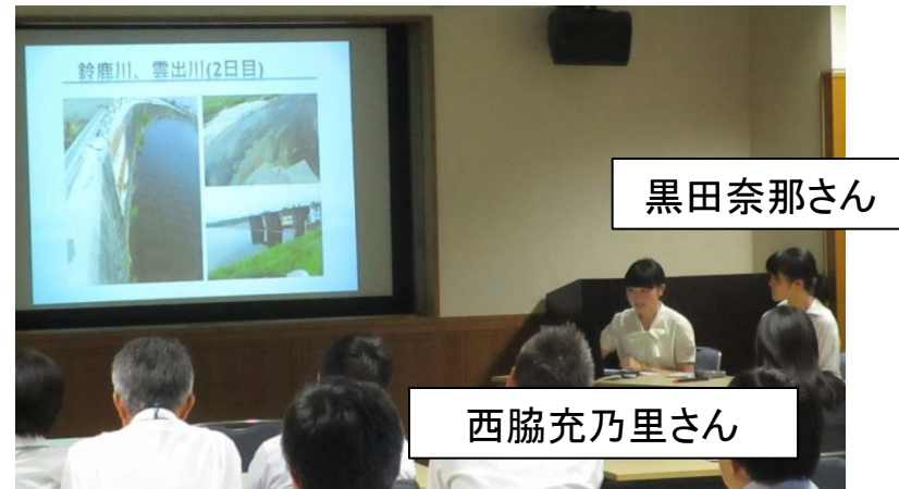
就業実習生の発表内容に対して、木曾川下流河川事務所の若手職員等がアドバイス