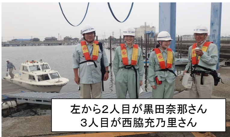
職員が実施する巡視船による河川巡視に同行