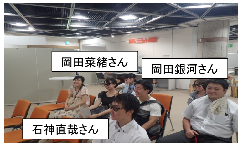
3D映像で土砂災害を疑似体験