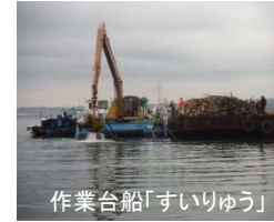
作業台船「すいりゅう」

ゴミの不法投棄は、地域の景観や環境を損うだけでなく、物によっては地域の土壌や水質に重大な影響を与えかねません。また、ゴミの処理にも多くの労力とお金(税金)がかかっています。いつまでもきれいな木曽三川を残すため、みな様のご理解ご協力をお願いします。