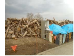
流木回収・集積作業(長良川右岸18.4k付近)