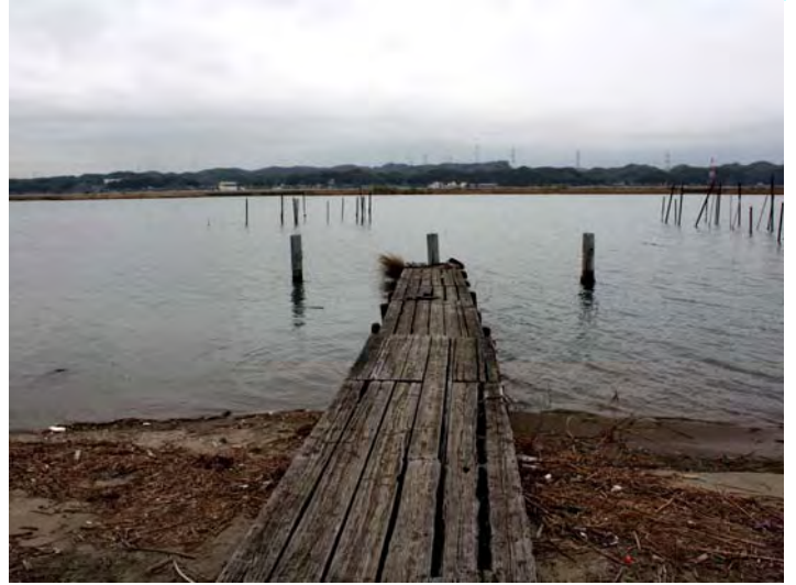
本日の作業後の状況