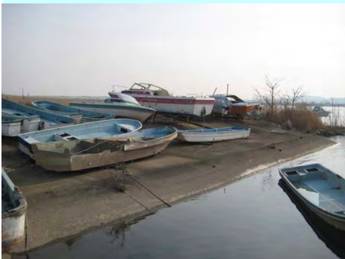
簡易代執行前の状況(H22.1.20撮影)