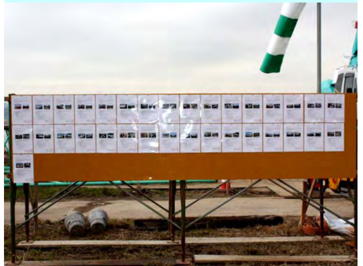
保管公示(撤去現場)