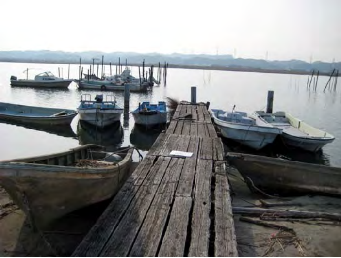
簡易代執行前の状況 (H22.1.20撮影)