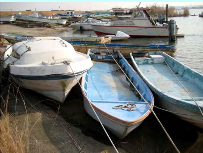
簡易代執行前の状況 (H22.1.20撮影)