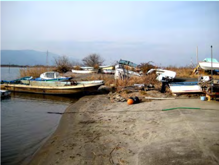
簡易代執行前の状況 (H22.1.20撮影)