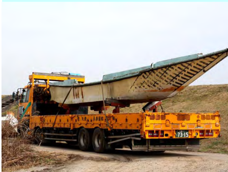
対象船舶のうち最も長い船舶