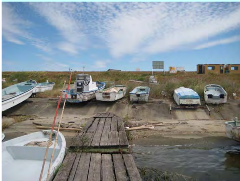
簡易代執行前の状況(H21.9.9撮影)