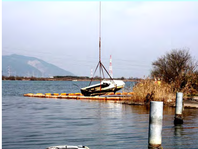
沈没していた船舶の撤去