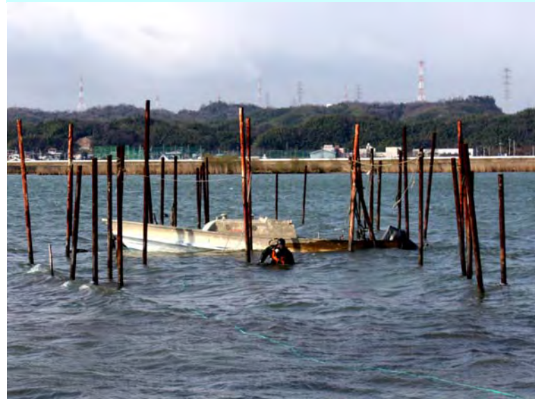
潜水夫による調査