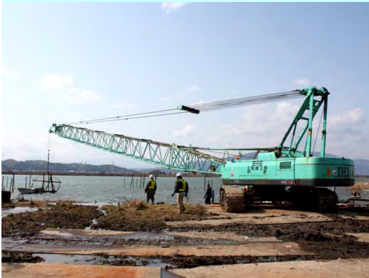
河岸から最も遠い船舶の撤去