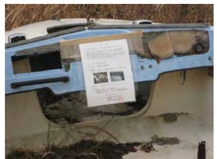
簡易代執行の公告（平成22年1月25日撮影）