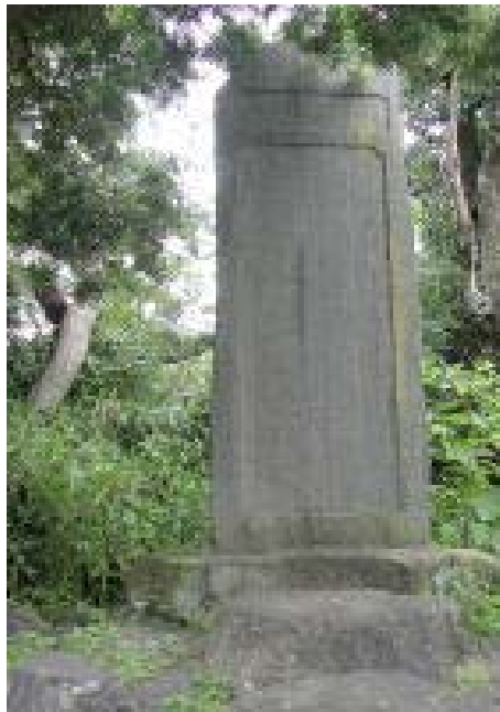
揖斐川廃川埋立記念碑・ 呂久新川付替記念碑

この改修工事により、湾曲のはなはだしかった呂久川は直線化した揖斐川として生まれ変わりましたが、元の流れに沿っていた市町村の境が飛び地として残ってしまったのです。