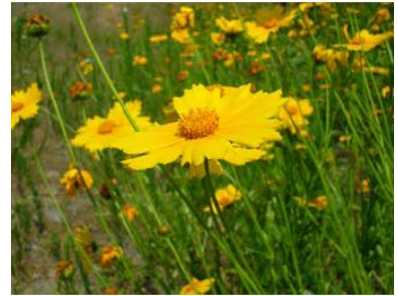
オオキンケイギク

今回の揖斐川第一出張所だよりのテーマは、 河川の堤防に自生している特定外来植物（オオキンケイギク） についてです。