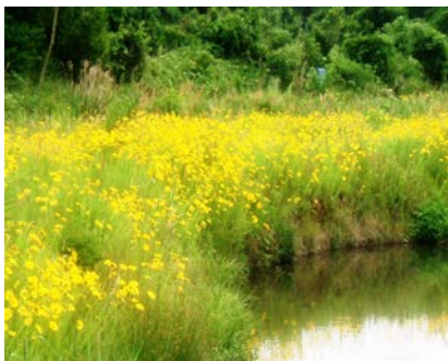
群生するオオキンケイギク