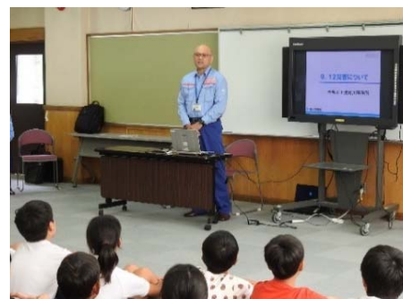
9.12豪雨災害や岐阜県内の過去の災害の被害状況等について説明