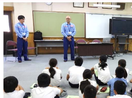
木曾川上流河川事務所より 講評とまとめ