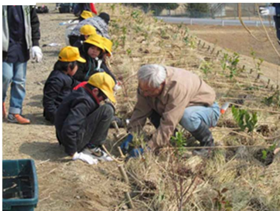
第18回「市民参加の森づくり」植樹祭 (一宮市:平成26年2月26日)