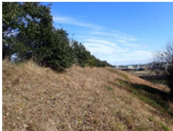
現在の植樹した樹木 令和6年1月19日撮影