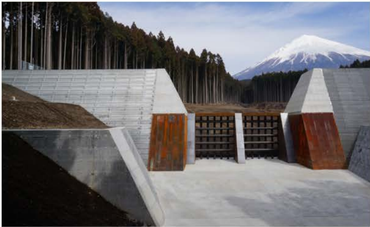
さほうえんてい しずおかけんふじのみや 砂防堰堤 (写真の場所：静岡県富士宮市) たいふうがふったとき、やまからながれてくるおほ いわ どしゃ き 大雨が降ったときに、山から流れてくる大きな岩、土砂、木な どをせき止めて、山のふもとのまち まも 町を守ります。