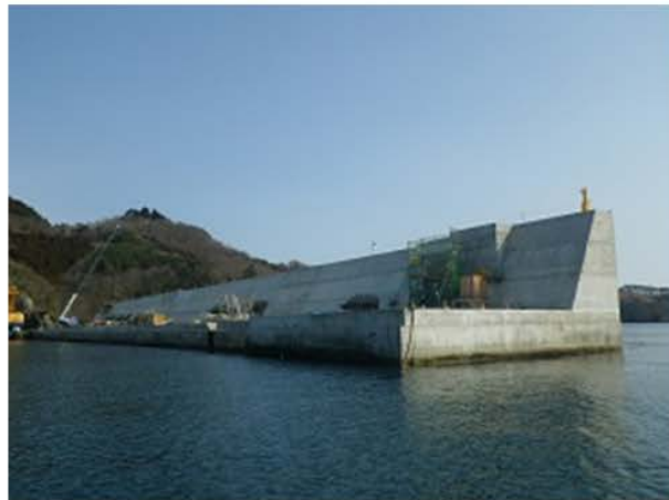
ほうはうてい いわて おおふなと おおふなところ 防波堤 (写真の場所：岩手県大船渡市 大船渡港) たいふうのときのおお なみ じしん つなみ およ 台風の時の大きな波や地震による津波が押し寄せたときに、まち しんすい が浸水するのを防ぎます。