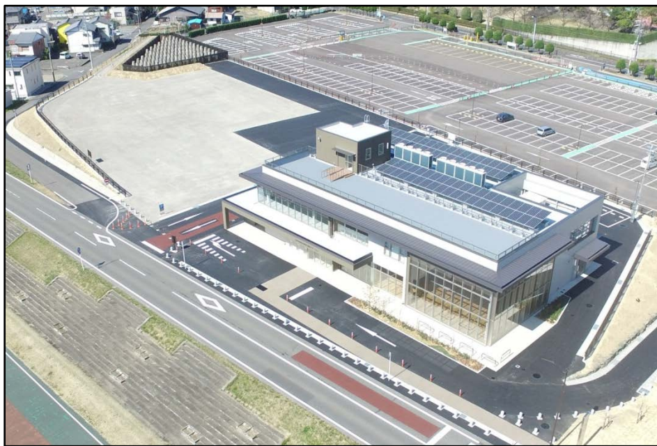
ながらがわ 長良川にある河川防災ステーション