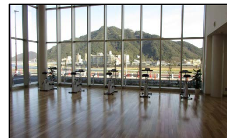
健康ステーション