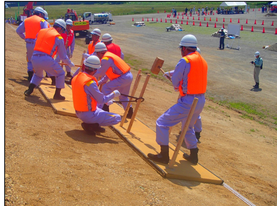
水防団による水防工法訓練