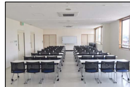
かいぎしつ 会議室