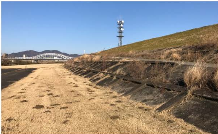
かせんていほう きふけん きふし ながらかわ 河川堤防 (写真の場所：岐阜県岐阜市 長良川) たいふうやたいふうで川のながれが増えたとき、川のながれがあふれて、しゅうへん まち しんすい 町が浸水するのを防ぎます。