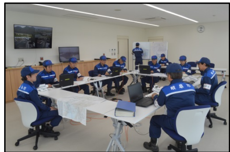
しれいしつ 指令室