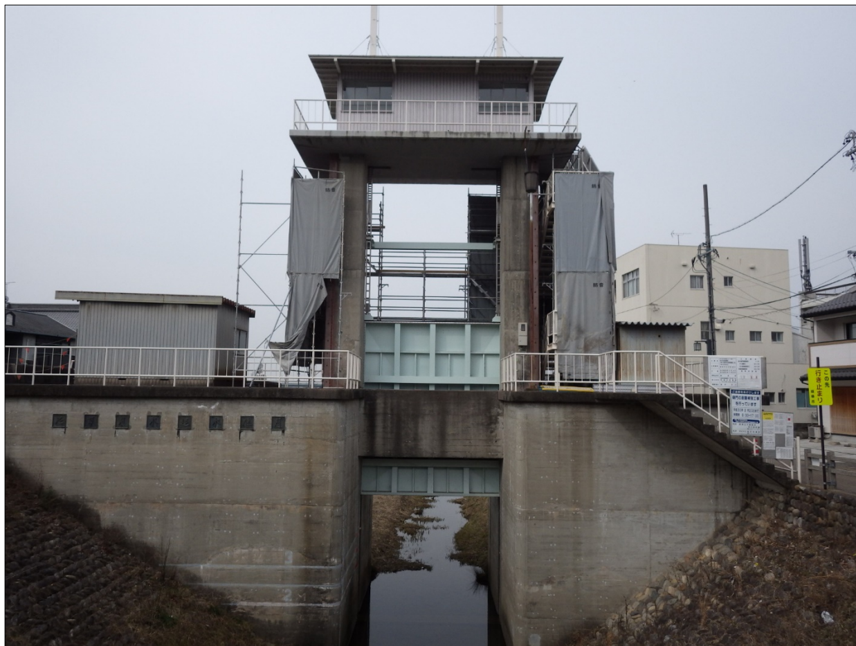
ちゅうせつようすい ながらがわ ごうりゅうちてん ぎゃくすいひもん 忠節用水と長良川との合流地点にある逆水樋門

樋門・樋管とは、川や水路を流れる水が大きな川に合流する場合、合流する川の水位が洪水などで高くなった時に、その水が逆流しないようにする施設です。