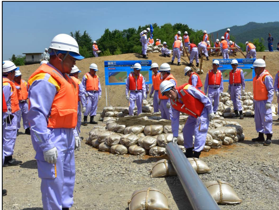
すいぼうだん 水防団による水防工法訓練