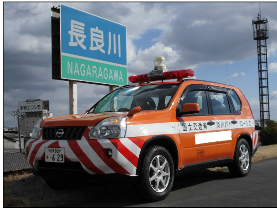
河川パトロールカー