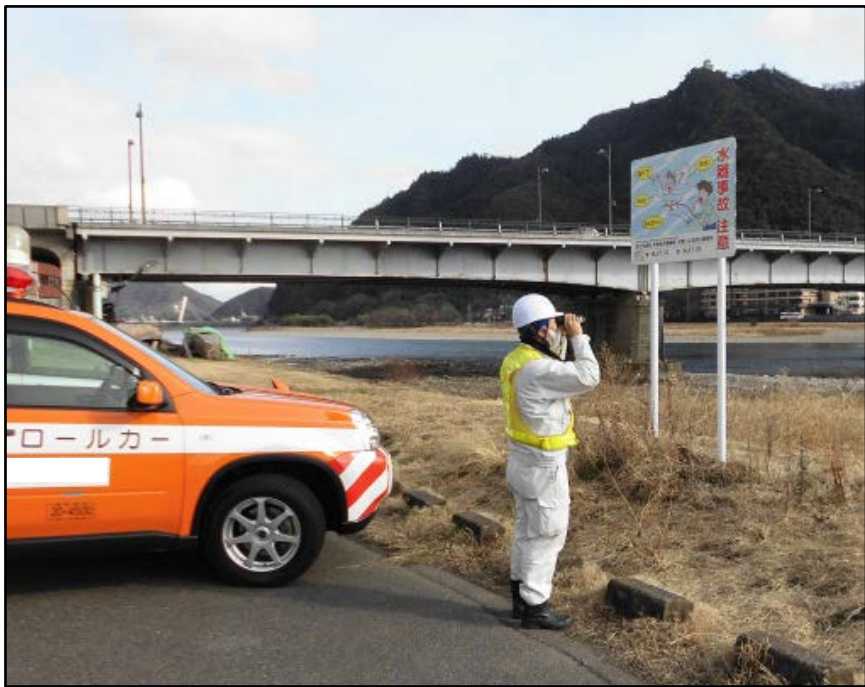
異常がないか確認

かわ みず あんぜん なが 川の水が「安全に流れているか」「堤防などに異常がないか」などを確認するために、河川パトロールカー おこな ーで川のパトロールを行っています。