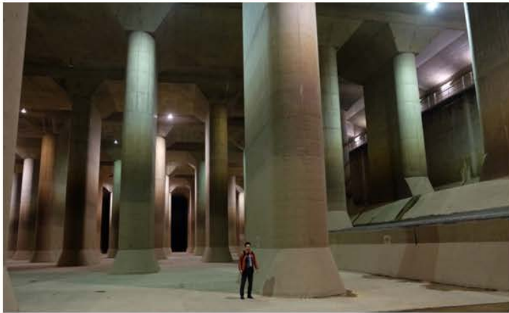
しゅとけんがいかくほうすいろ しやしん ばしよ さいたまけんかすかべ 首都圏外郭放水路 (写真の場所：埼玉県春日部市) どうろのした やく 50m のふかさ ちか たいふう おおあめ 道路の下、約50mの深さにある地下の水路です。台風や大雨で しゅうへん かわ まえ すいろ なが すいがい ふせ 周辺の川があふれる前に地下の水路に流し、水害を防ぎます。