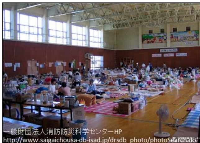
一般財団法人消防防災科学センターHP http://www.saigaichousa-db-isad.jp/drdsb_photo/photoSearch.do

きょう じゆぎょう まな さいがい ■今日の授業で学んだ「災害 を防ぐ行政の取り組み」を通 して、わかったことをまとめ ましょう。