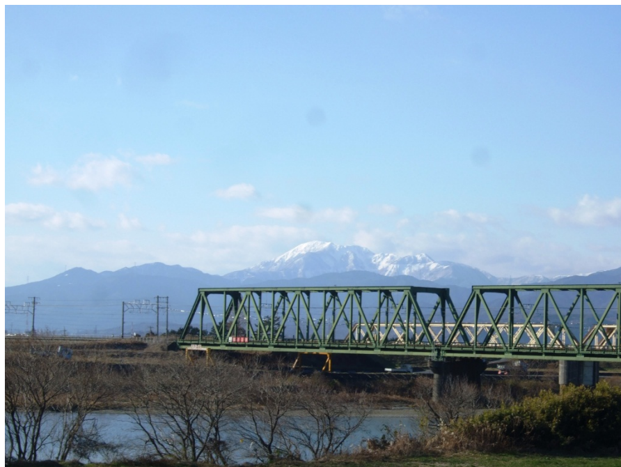
橋(手前)：JR揖斐川橋 橋(奥)：旧揖斐川橋