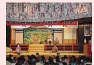
村国電子楽隊演奏