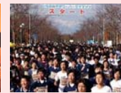
いちのみやタワーパークマラソン