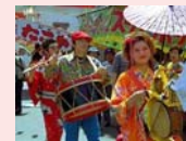
全国チンドンまつり