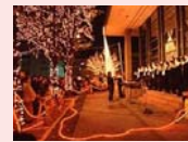
ホワイトイルミネーション