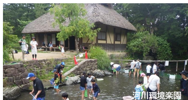
夏の楽園祭(アユのつかみ取り) 2025.8 撮影