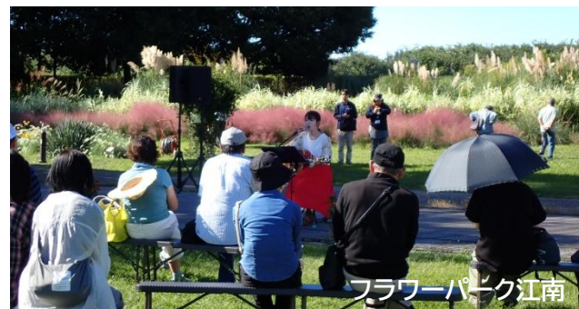
秋のガーデンパーティ 2025.10 撮影