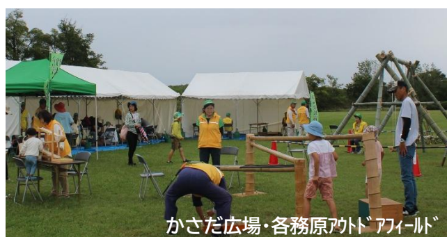
竹の大国で遊ぼう 2025.10 撮影