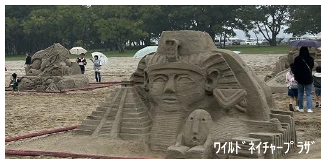
稲沢サンドフェスタ2025 2025.10 撮影