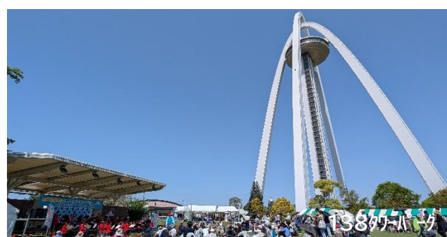
スプリングフェスタ 2025.5 撮影