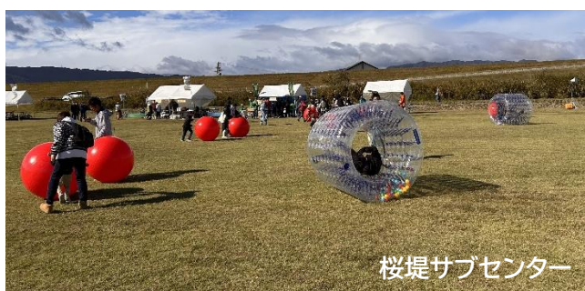
ピクニック日和(大玉サイバーホイールであそぼう) 2025.11 撮影