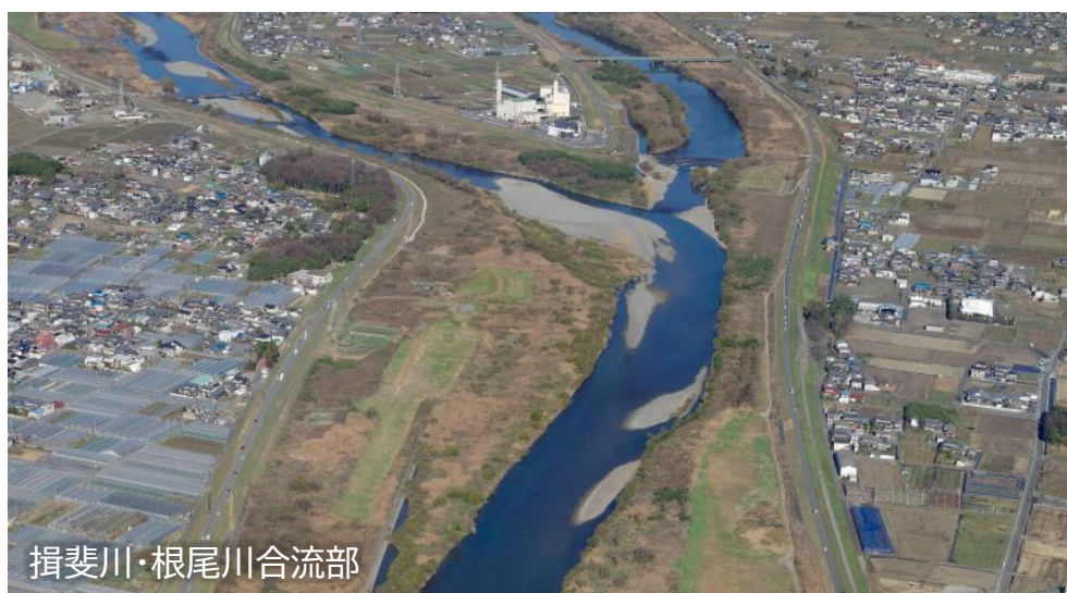
揖斐川・根尾川合流部