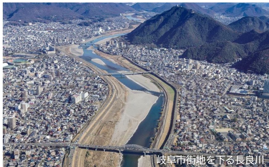
岐阜市街地を下る長良川