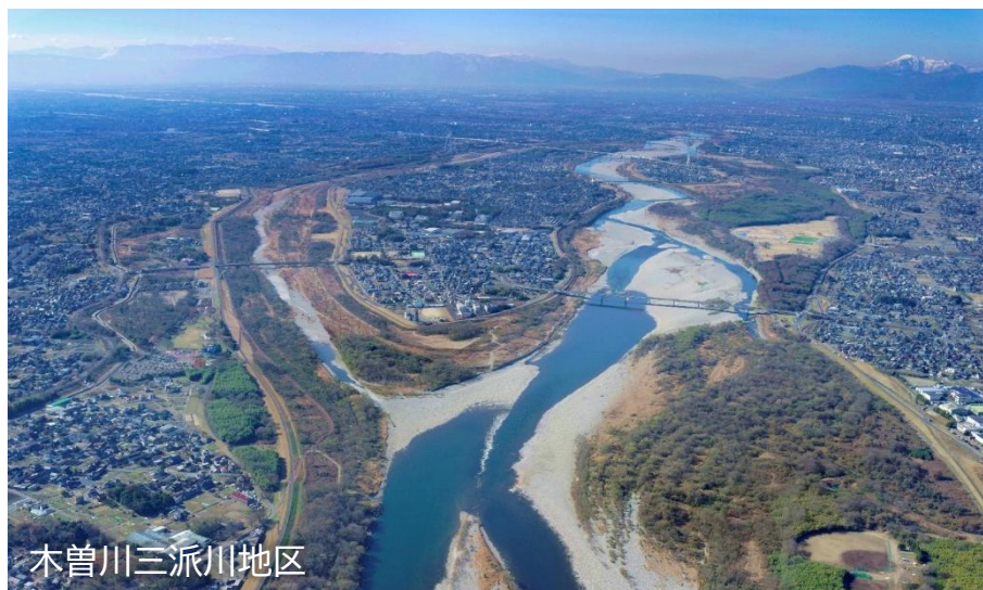
木曽川三派川地区