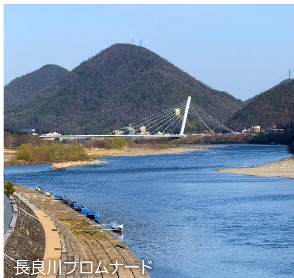
長良川プロムナード