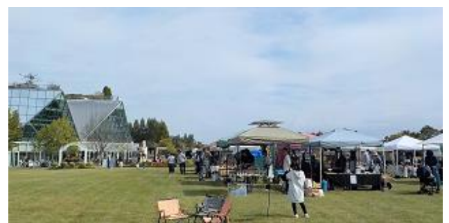
第12回hanaマルシェ 2023.10撮影