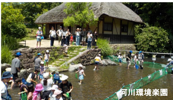
春の楽園祭 マスのつかみ取り 2023.5撮影