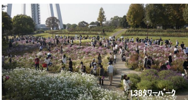
オータムフェスタ 2023.11撮影