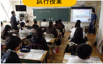
事務所が開発した教材を使ったマイ・タイムライン作成