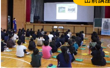
国の取り組み(公助)についての講座