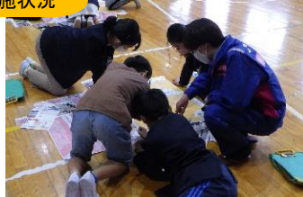
マイ・タイムライン作成講座でのグループワークの様子