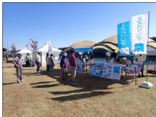
River to Summit(令和5年11月)における ブース出展の様子