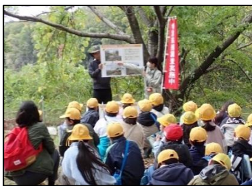
環境学習の実施状況