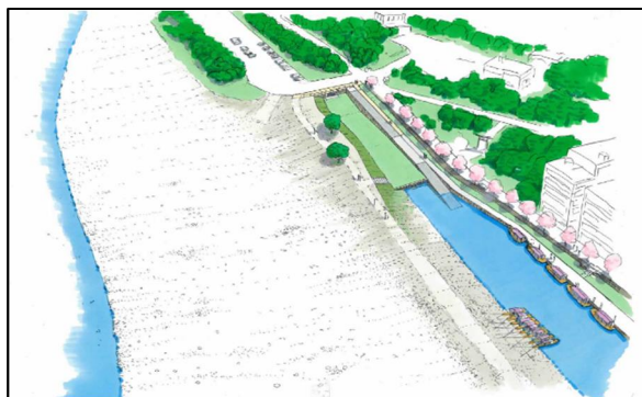
ぎふ長良川鶴飼かわまちづくり 完成イメージ(令和6年3月時点)