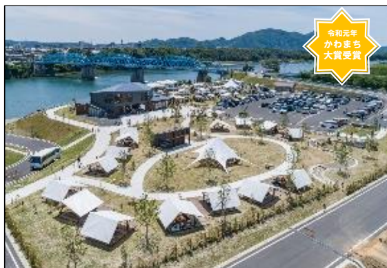
リバーポートパーク美濃加茂 (美濃加茂市かわまちづくりにおいて整備)