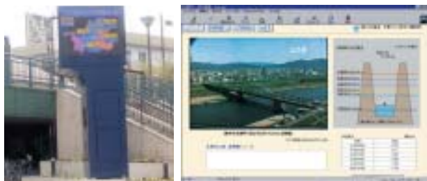
河川情報板(長良川)