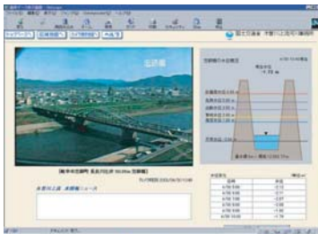
インターネット画面

堤防沿いにCCTVカメラを設置して防災や河川管理の高度化に活かします。この画像は、地域住民のみなさんへもインターネット等を通じて情報提供します。