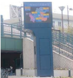
河川情報板(長良川)