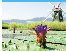
●オニバス(絶滅危惧II類)