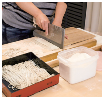
打ちたてのそばに舌鼓「そば打ち体験」