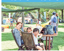
●わくわく体験まつり