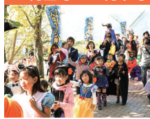
●ハロウィーンパーティー