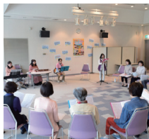
みんなで合唱体験「Let's Sing」

日替わりで開催されるパークパートナーによるアートやクラフト、料理などの体験教室も魅力の一つです。