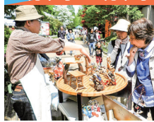
●海津アクアマルシェ&ハンドメイド市