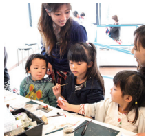
子どもたちに大人気の「木工教室」