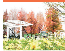
●モミジパフウの紅葉