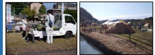
軽トラ市 犬山栗栖園地