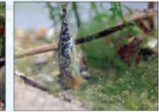
さざれ石（岐阜県天然記念物）