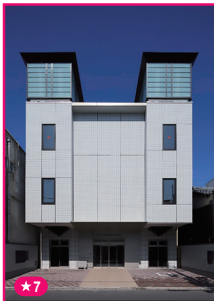
★7 笠松町歴史未来館