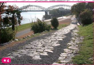
★4 木曾川笠松渡船場跡(石畳)