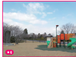
★6 蘇岸築堤記念碑公園