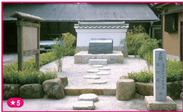
★5 美濃郡代笠松陣屋・県庁跡