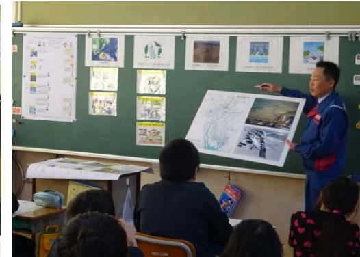
ハザードマップ等の説明(安八町・国交省) マイ・タイムラインについて(国交省)