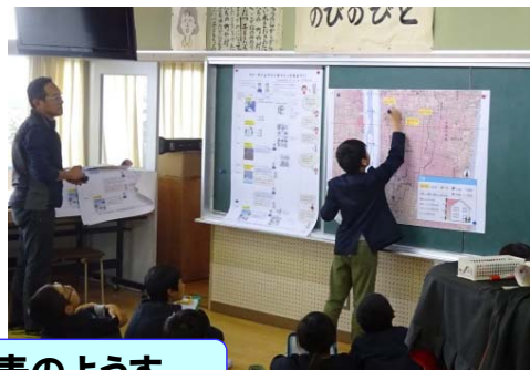
みんなの発表のようす