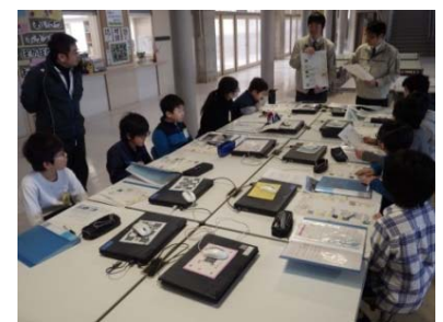
いつ、何をすれば良いのか、 おうちの人と話し合ってきてね