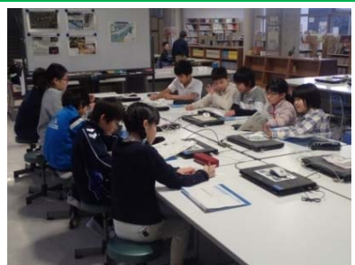
考えてきたことをみんなで話し合おう