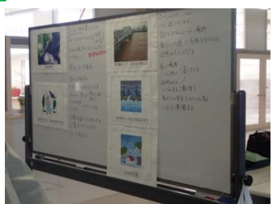
考えた意見をまとめる