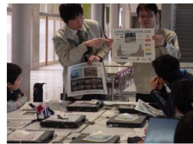
出水時に得られる情報を知ろう (ライブカメラ、川の水位等)