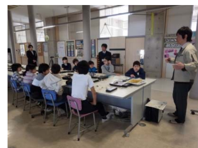
これまでの内容をもとに、 マイ・タイムラインを作ってみよう