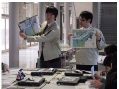
水害のリスクを知ろう 「岐阜小学校版ハザードマップ」