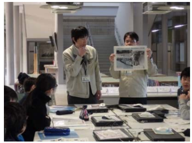
過去の水害を知ろう