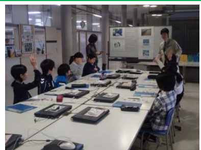
考えた意見を発表しよう