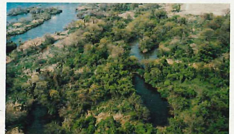
木曽川にみられるワンド