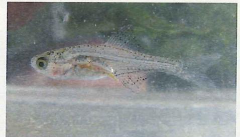
イタセンパラの稚魚