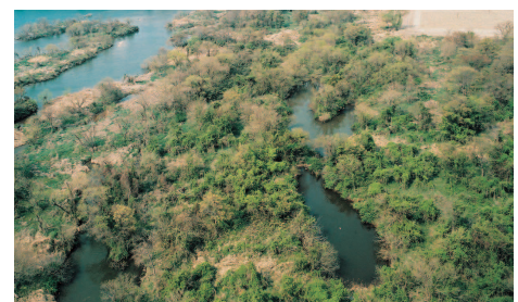
木曾川にみられるワンド