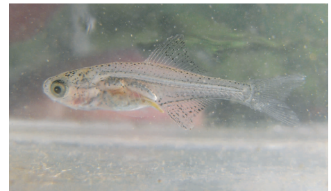
イタセンパラの稚魚