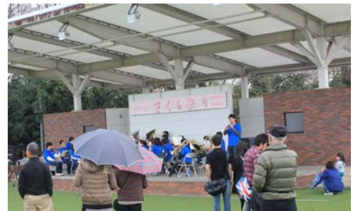
※写真は昨年（平成25年）の状況