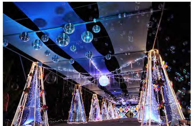
※写真は昨年度の様子