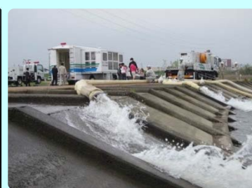
災害対策車両の稼働状況 左：照明車 右：排水ポンプ車