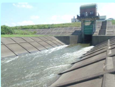
ポンプを動かし排水を確認