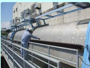
除塵（じょじん）機の点検