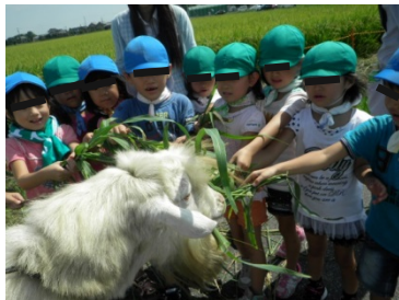
園児とヤギとのふれあい状況