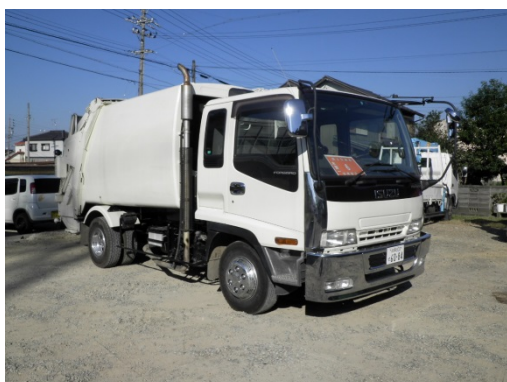
パッカー車(刈草運搬機械)