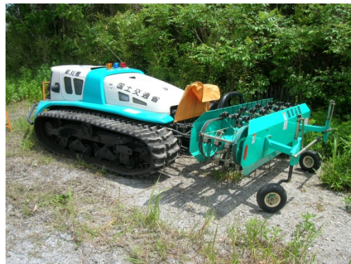
リモコン式草刈機(集草時)