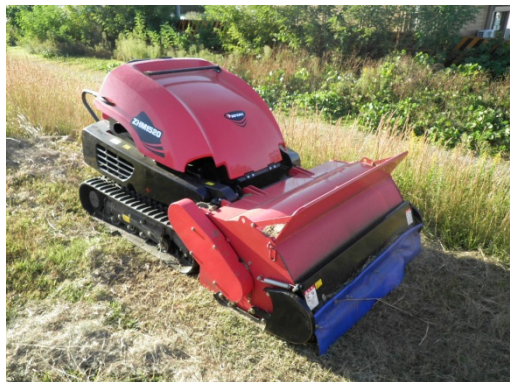
ハンドガイド式草刈機