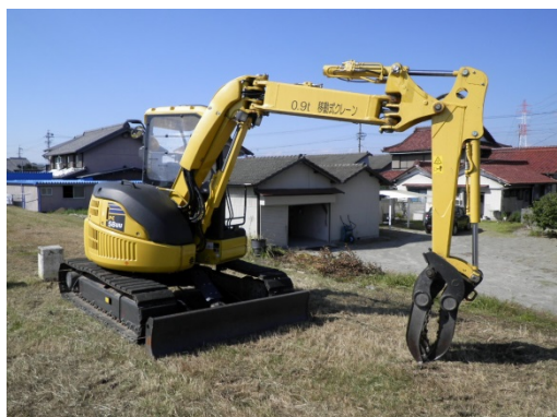
バックホウ(刈草積み込み機械)