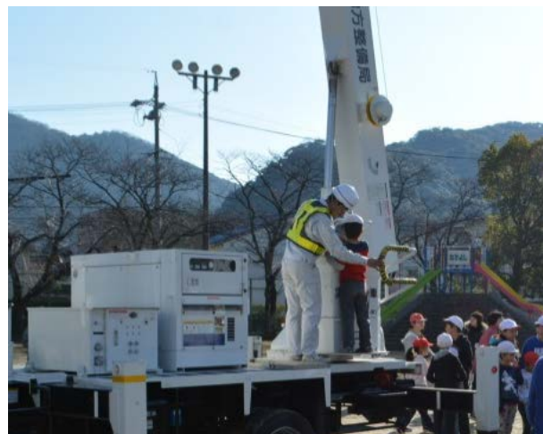
照 明 車