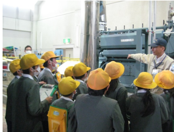
エンジン室の見学