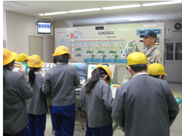
中央操作室の見学