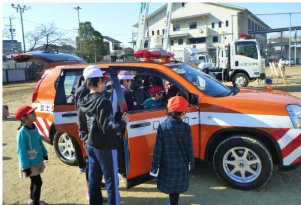
河川パトロール車