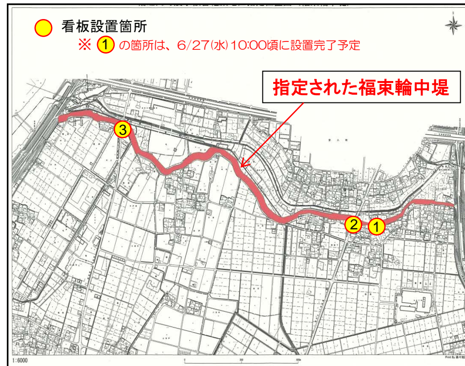
輪之内町浸水被害軽減地区 看板設置箇所図