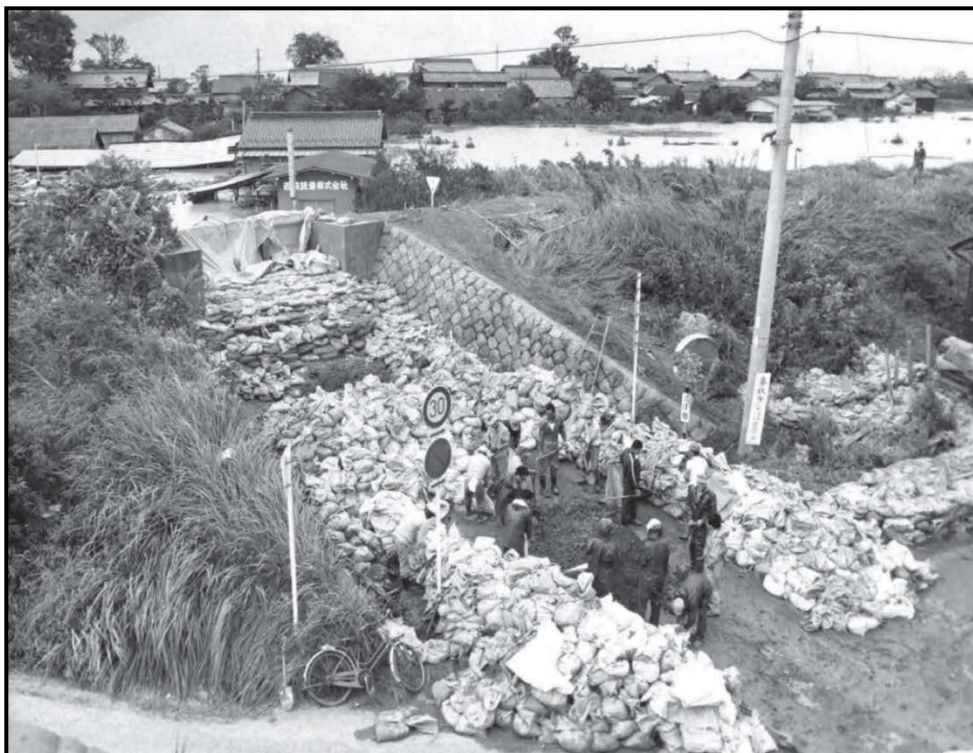
旧輪中堤で浸水をくい止めた水防活動

この度は、出水期・台風期を迎えるにあたり、「浸水被害軽減地区」である福束輪中堤について広く認識いただき、水防災意識社会を再構築するため、現地に案内看板を設置することとしました。