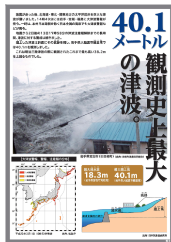
「忘れない」パネルの一例