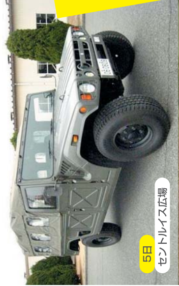
5日 セントルイス広場