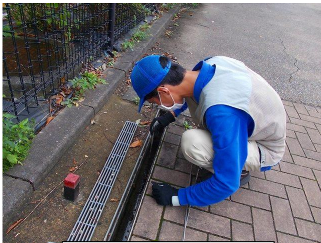
⑥ 緊急点検 P A前横断側溝