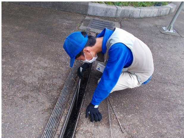
⑤ 緊急点検 第2ゲート前側溝