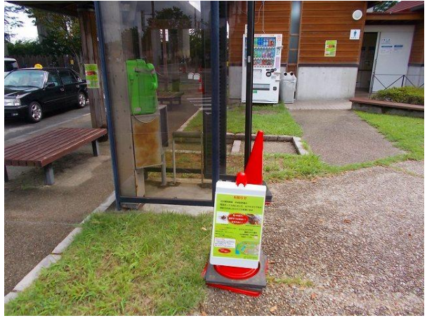
④ 注意喚起看板(近景)