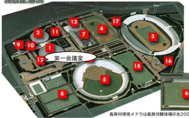
長良川球技メドウは長良川競技場の北200m