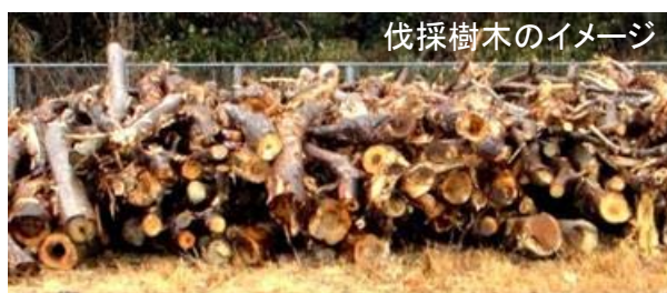
伐採樹木のイメージ