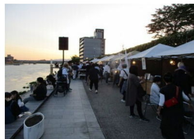
※長良川右岸プロムナードエリア R5.5.11「長良川夜市」

今回、「笠松みなと公園」を令和6年3月22日付、「各務原市前渡地区」を令和6年3月28日付で指定予定。（木曾川上流河川事務所管内では「長良川右岸プロムナードエリア」に続き2例目・3例目）