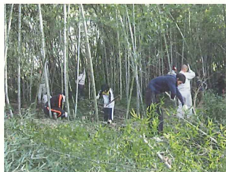
市民団体による活動事例(長良川)