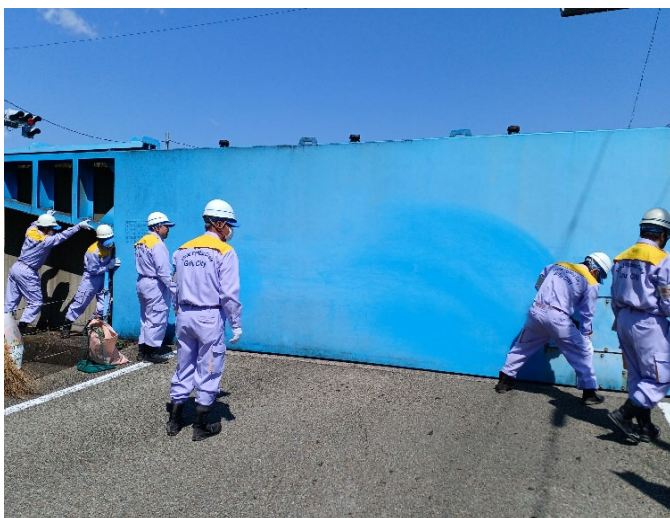
大前町陸閘の閉鎖訓練上場