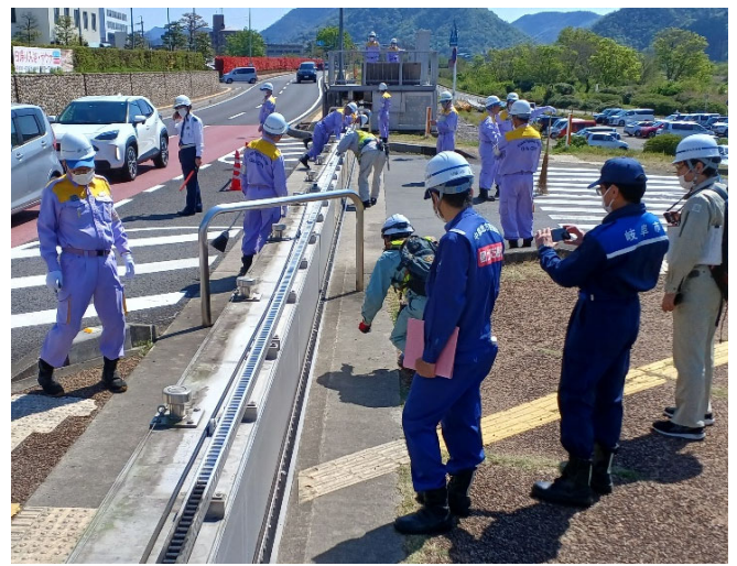
築地陸閘閉鎖及び点検状況