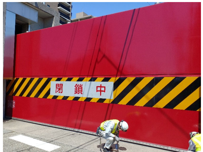
長良南町陸閘の閉鎖及び点検状況