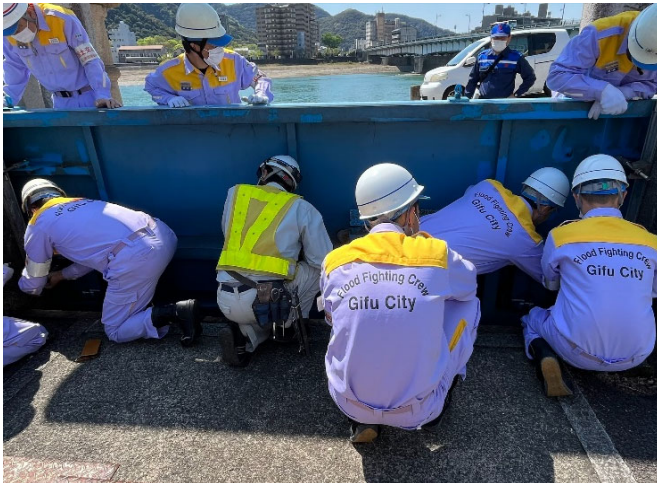
鵜飼屋陸閘群の閉鎖及び点検状況