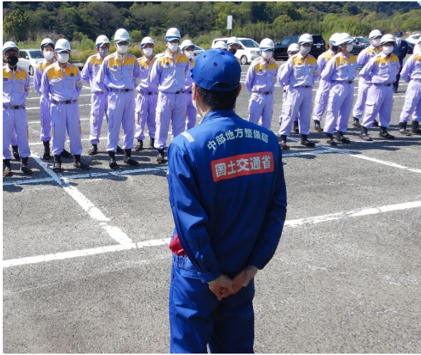
訓練開始前の出張所長挨拶