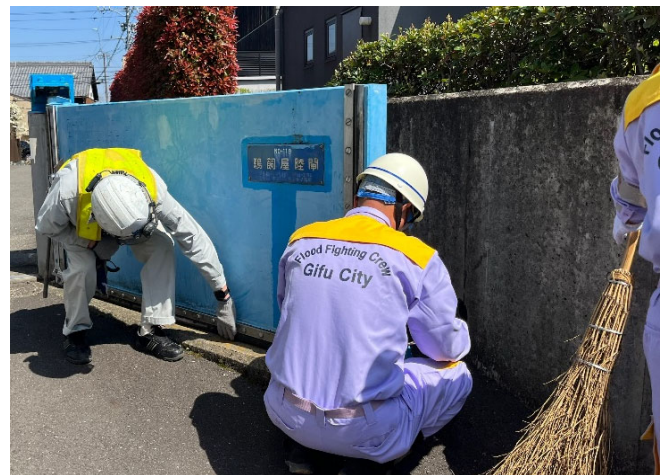
鵜飼屋陸閘群の閉鎖及び点検状況