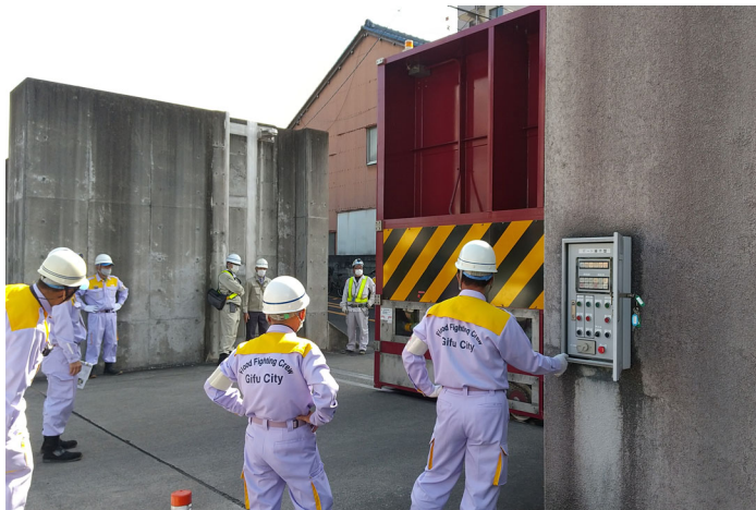
長良南町陸閘閉鎖の様子