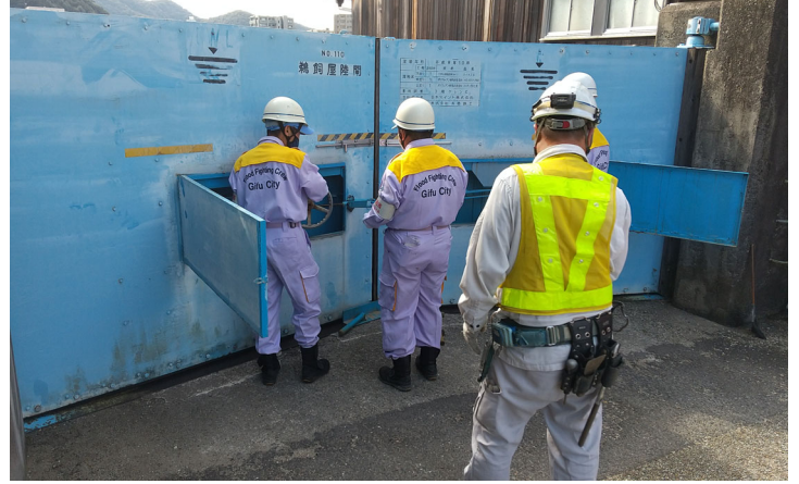
鶺鴒屋陸閘閉鎖の様子