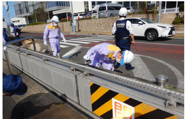
築地陸閘閉鎖の様子