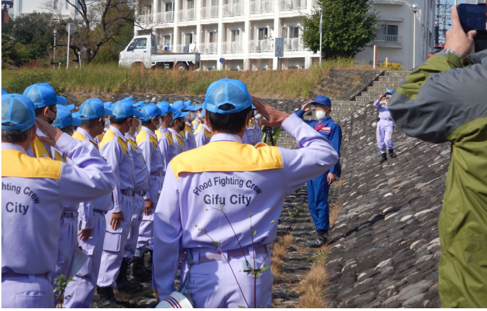
出張所長挨拶の様子