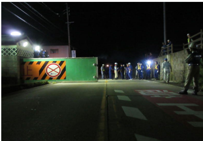
陸閘閉鎖作業中の状況