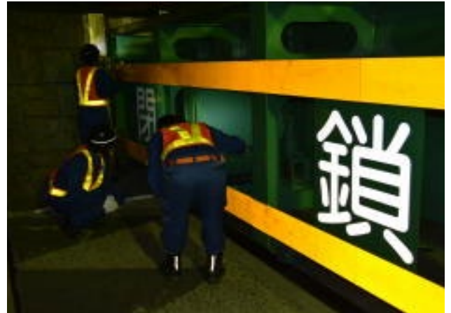
陸閘点検の実施状況