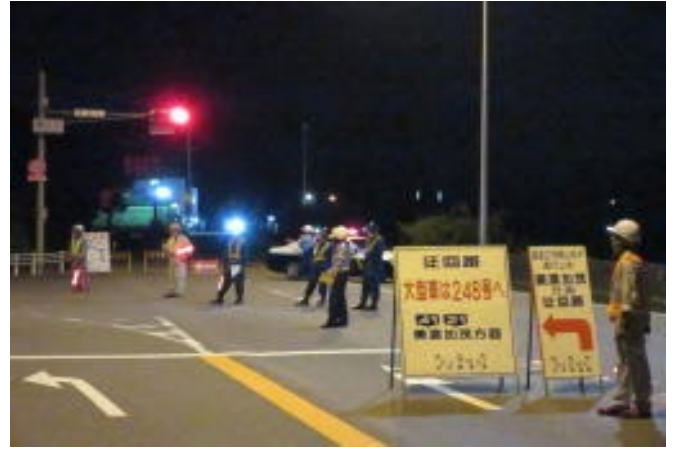
勝山西交差点での通行規制状況 (鵜沼側より勝山陸閘を望む)