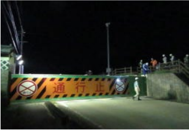
陸閘全景(通行止め実施状況) (鵜沼側より勝山陸閘を望む)